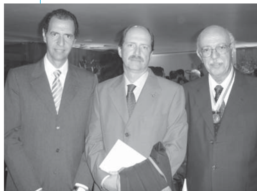
e/d: Fabio, Corsi e Jatene na homenagem no Rio

Jatene foi o responsável pelo desenvolvimento do primeiro aparelho artificial de coração-pulmão no HC, muito utilizado em cirurgias cardíacas. O cardiologista também desenvolveu várias técnicas de revascularização do coração e outras para corrigir doenças congênitas, que são utilizadas até hoje e já salvaram centenas de vidas.